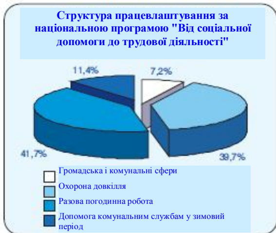
Діаграма 3. Структура працевлаштування за національною програмою "Від соціальної допомоги до трудової діяльності"